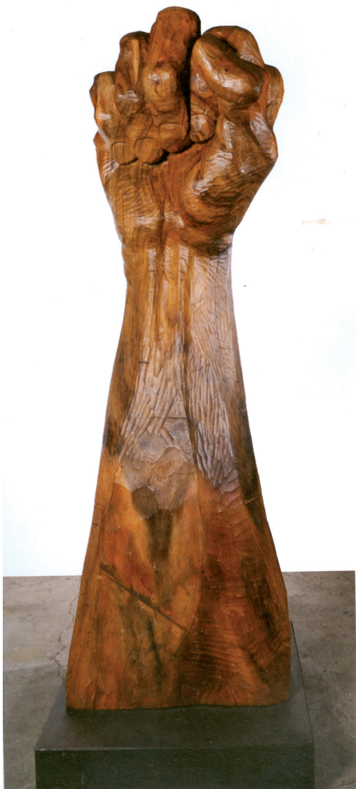
Yo protesto , de Néstor Zeledón