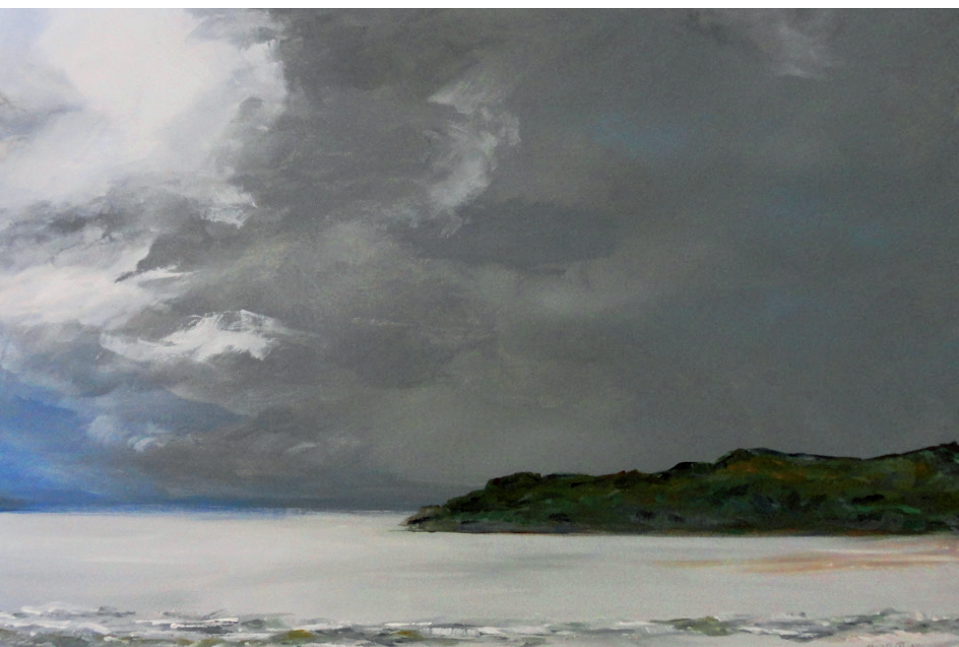
Playa , de Miguel Casafont