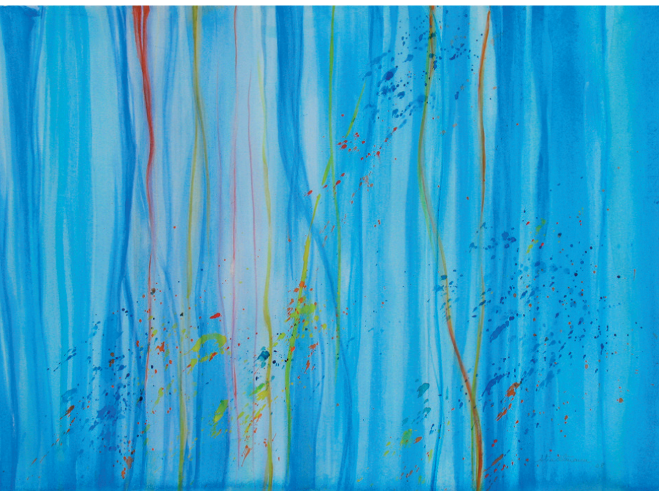
Bosque , de Gisela Stradtman