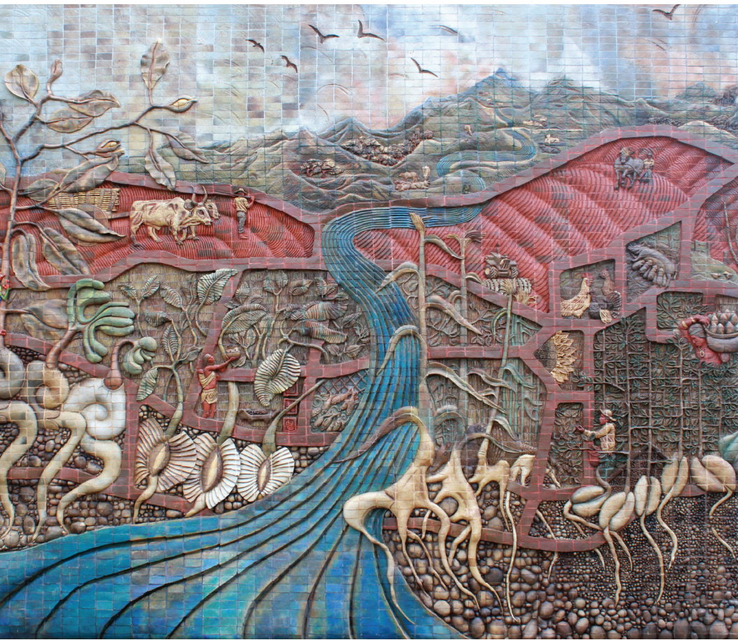
Tierra, agua y semilla , de Ivette Guier